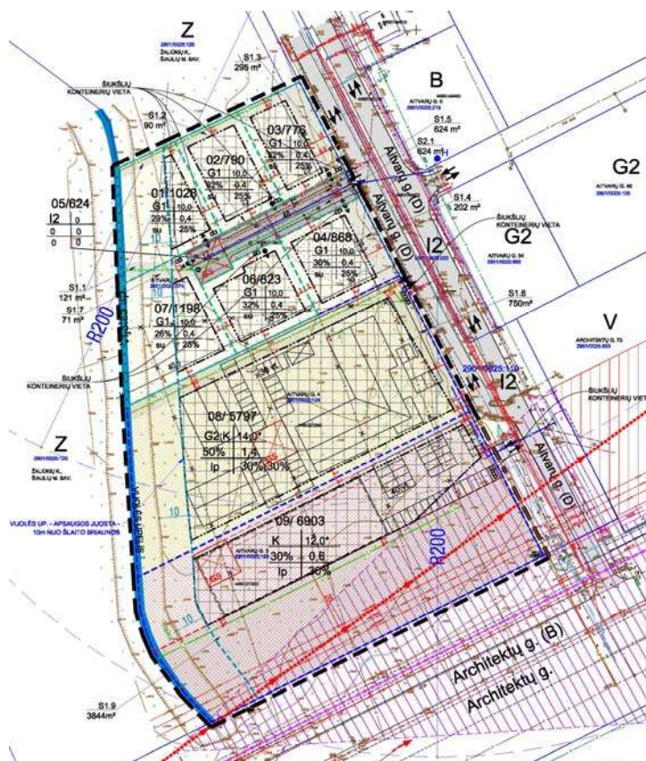
Schema Nr.1- PATVIRTINTAS „DETALIOJO PLANO, KURIO REGISTRACIJOS NR.700088407, KEITIMO“ DETALIUSIS PLANAS. TPDR REG. NR.T00090639

Patvirtintame detaliojame plane, sklypams, kurie ribojasi su Vijolės upeliu, buvo nustatyta 10m pakrantės apsaugos juosta nuo upelio šlaito briaunos, vadovaujantis senu detalioju planu Nr.T00088407. Šiuo patvirtinto detaliojo plano Nr.T00090639 nepagrindinio rodiklio koregavimu, koreguojama užstatymo linija ir zona registruotuose sklypuose Aitvarų g.6 (kad.Nr.2901/0025:897); Aitvarų g. 6E (kad. Nr.2901/0025:8960; Aitvarų g.4 (kad. Nr.2901/0025:124) ir Aitvarų g.2 (kad. Nr.2901/0025:123).