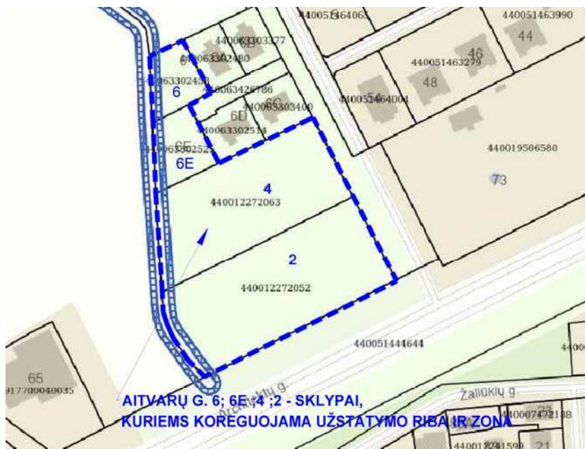
Schema Nr.2 – PAVIRŠINIŲ VANDENS TELKINIŲ APSAUGOS JUOSTŲ (ZONŲ) ŽEMĖLAPIS

Rengiamo detalaus plano sprendiniai nepažeis LR Specialiųjų žemės naudojimo sąlygų įstatymo str.99 ir 100 nuostatų. Sklypų užstatymo zona planuojama atitraukti už 8m nuo paviršinio vandens telkinio šlaito briaunos.