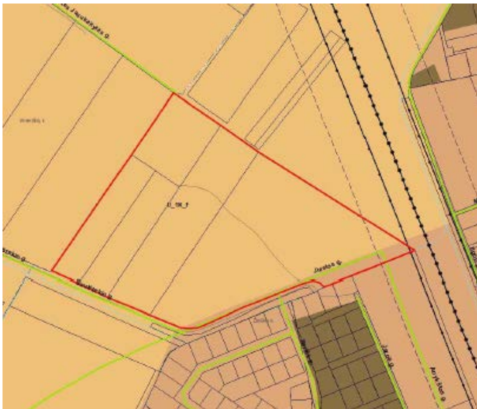
Ištrauka iš Šiaulių rajono bendrojo plano keitimo