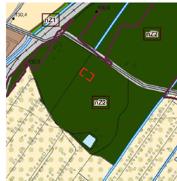
ĮŠTRAUKA IŠ ŠIAULIŲ MIESTO BENDROJO PLANO