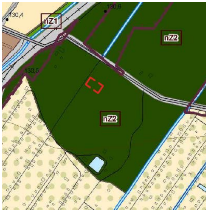
Ištrauka iš Šiaulių miesto bendrojo plano