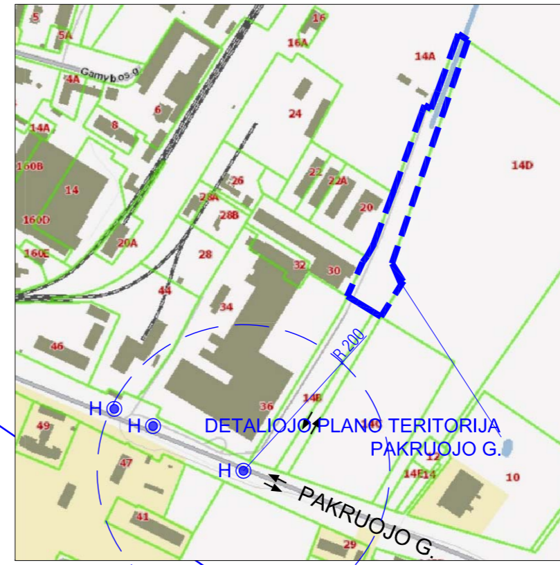
SITUACIJOS SCHEMA - ESAMI HIDRANTAI TERITORIJOJE SCHEMA 2